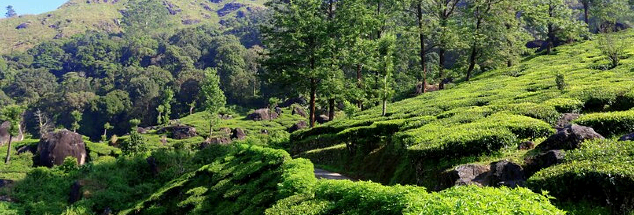
Plantations de thé à Munnar