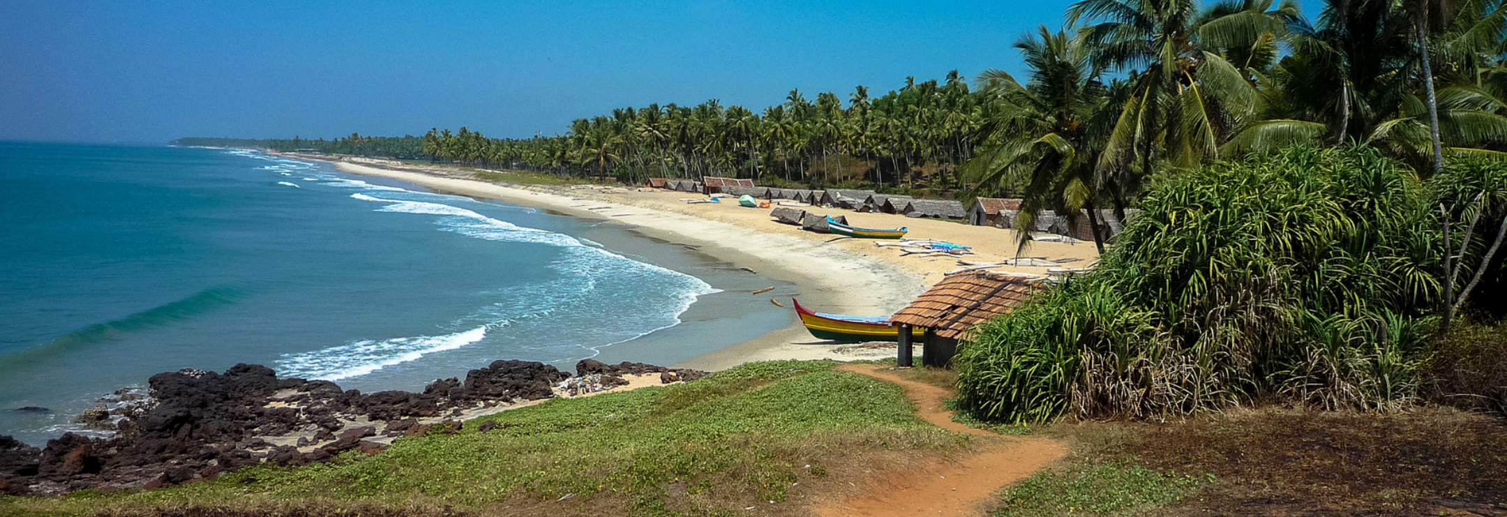
Plage d' Edava près de Varkala