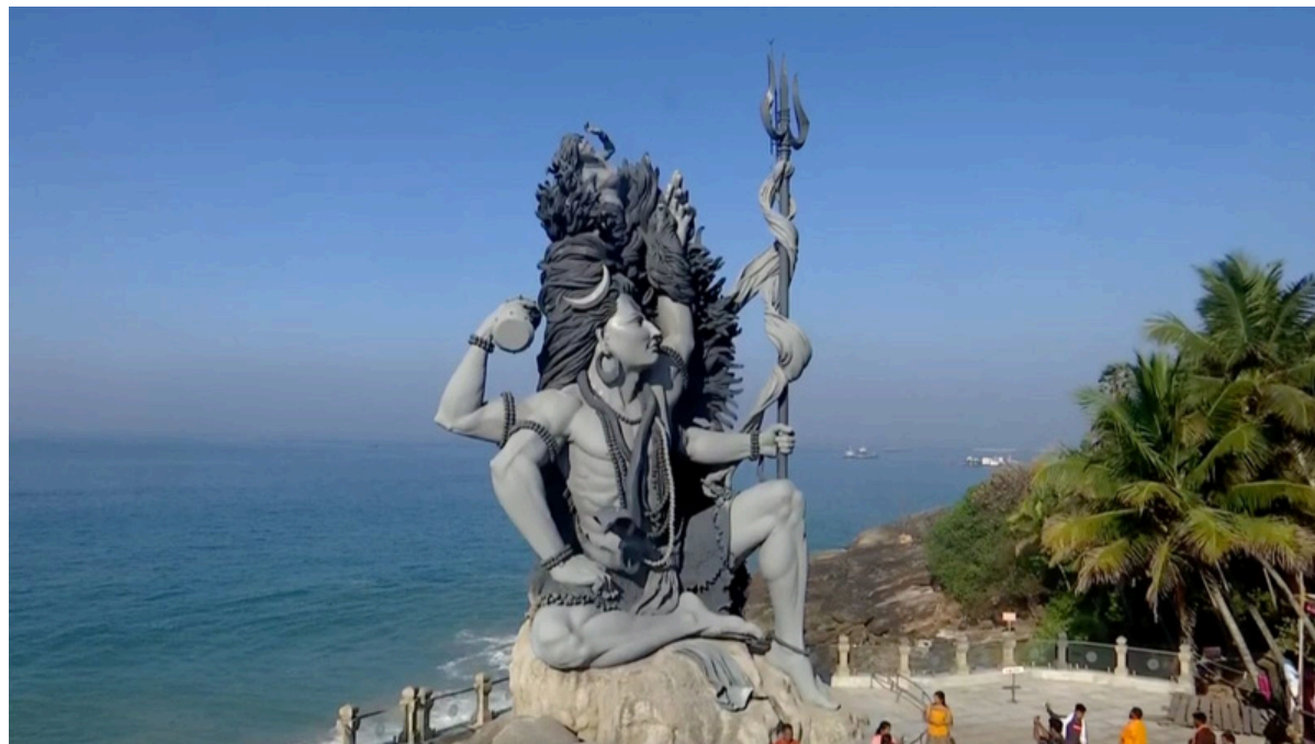
Aazhimala Shiva Temple

Retour à l'aéroport de Cochin en fonction de l'heure de départ du vol.